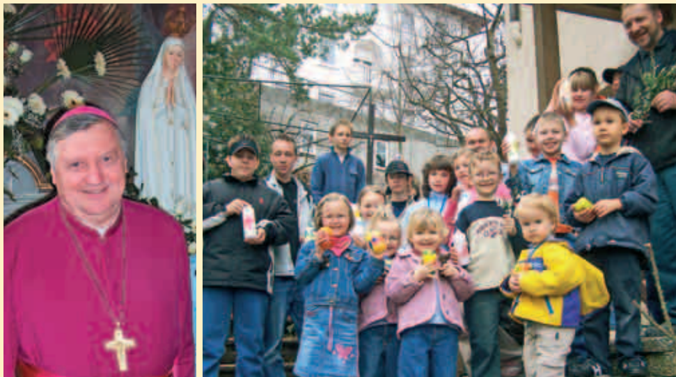
nadškof in slov. metropolit Alojz Uran